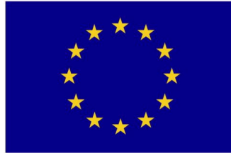
Euroopa Liit Euroopa Sotsiaalfond